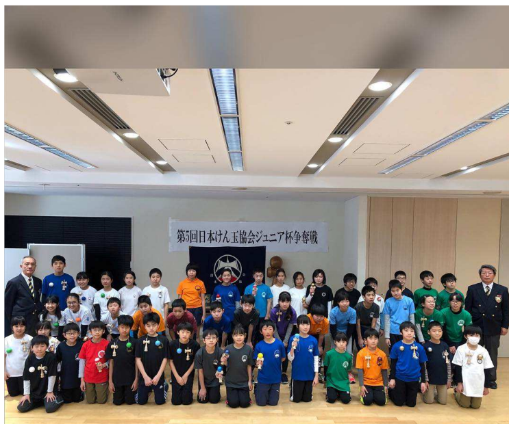
第5回JKAジュニア杯 参加者記念撮影(47名)