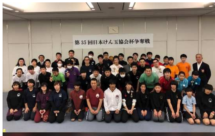
第35回日本けん玉協会杯(JKA杯)参加者記念(53名)